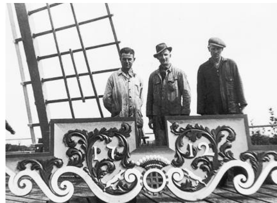
De vernieuwde baard.

gen werd grote schade aangericht. Een Studebaker was zwaar beschadigd terwijl bij een Diamond-vrachtwagen het cardan er finaal onder uit geschoten was! Het pakhuis langs de Schie was in vlam-