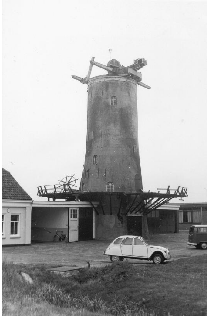
Sloop van de molen in verband met de verplaatsing naar de Kleiweg, 28 juli 1971.