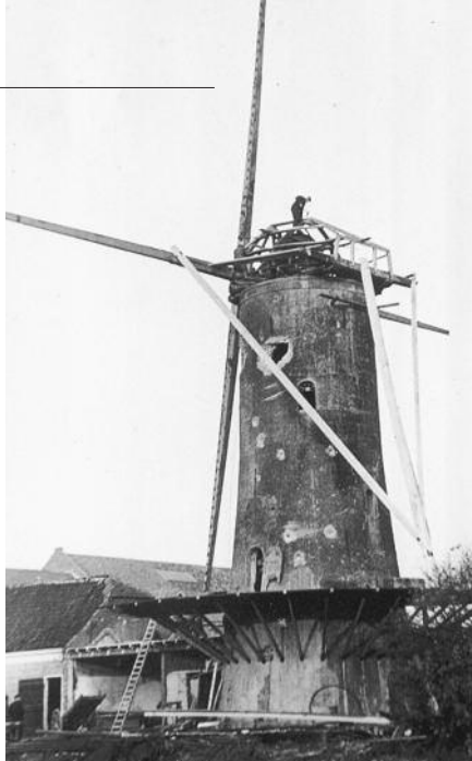
Rinus Lindhout op de kap: van hoogtevrees had hij geen last! (foto E. Speelman).

De Nederlanders waren er stellig van overtuigd dat de Duitsers in Overschie de molen "De Hoop" als uitkijkpost zouden gebruiken. Het zat er immers in dat ze een tegenaanval vanuit de richting Delft konden verwachten. Vandaar dat er van achter het erf van Rodenburg aan de rijksweg ten noorden van de molen op de molen geschoten werd om de veronderstelde Duitsers weg te krijgen. Dat er geen Duitsers zaten bleek wel bij het eerste schot. De Nederlandse commandant zag ineens een donkere wolk rond de molen. "Wat krijgen we nou", riep hij uit. Die wolk bleek niet anders dan een groot aantal duiven uit de molen te zijn dat daar hun domicilie had. Als er Duitsers gezeten hadden, dan waren de duiven wel weg geweest. Ook moet de molen niet alleen vanaf het noorden beschoten zijn, maar ook uit het zuiden, want ook daar zaten inslagen in de romp. Door de beschietin-