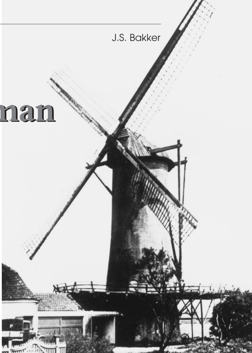
De molen van Speelman tijdens de moeilijke crisisjaren met een ondersteunde balie.

Een inslag gaf wel een mooie kijk op het dorp Overschie..