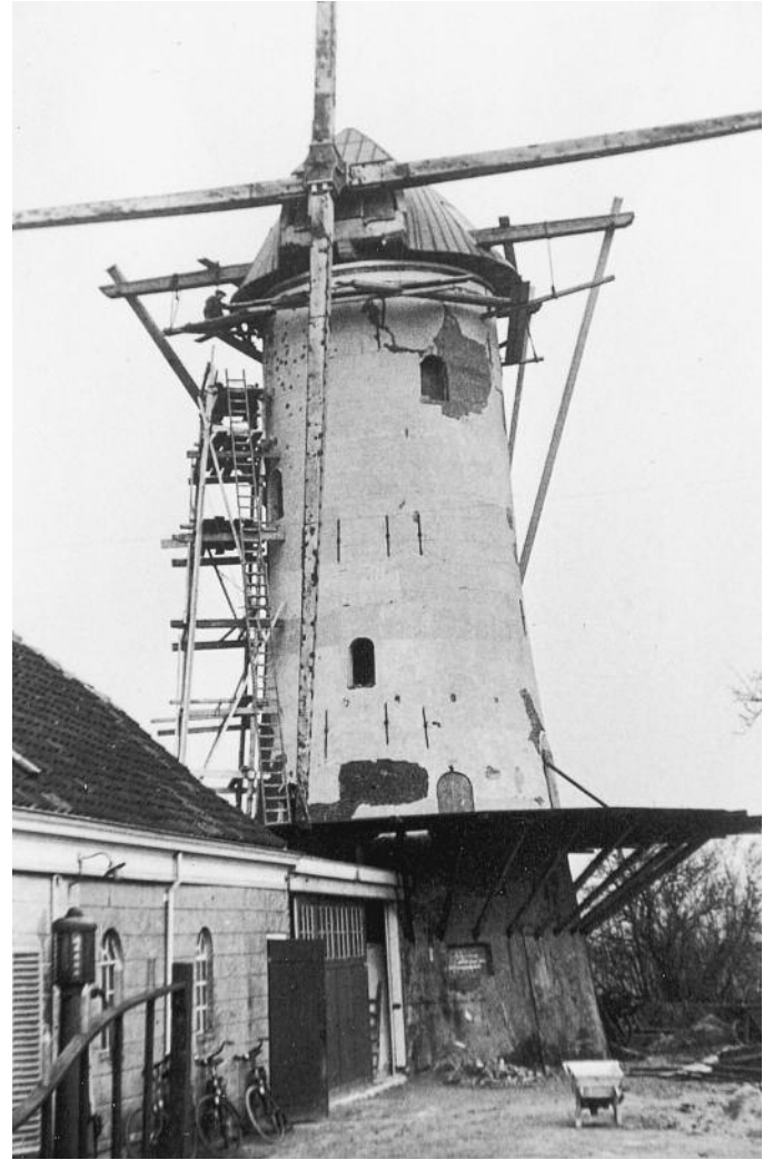
De metselaars aan het werk.

men opgegaan, terwijl ook de oliëfabriek van granaatvuur te lijden had. Zo was er een granaat door de muur heen naar binnen gekomen en in het lijnzaad terecht gekomen zonder te ontploffen. Groot was de schrik op het kantoor toen de fabrieksbaas zomaar eventjes met de onontploffte granaat kwam aanlopen, die tussen het zaad was gevonden! Ook de molen had de strijd niet ongeschonden doorstaan. Kogelgaten en granaatinslagen waren de sporen ervan. Na de capitulatie werden in de sloot bij de molen vier gesneuvelde Nederlandse soldaten aangetroffen. Maar de molen stond er nog, als door een wonder.