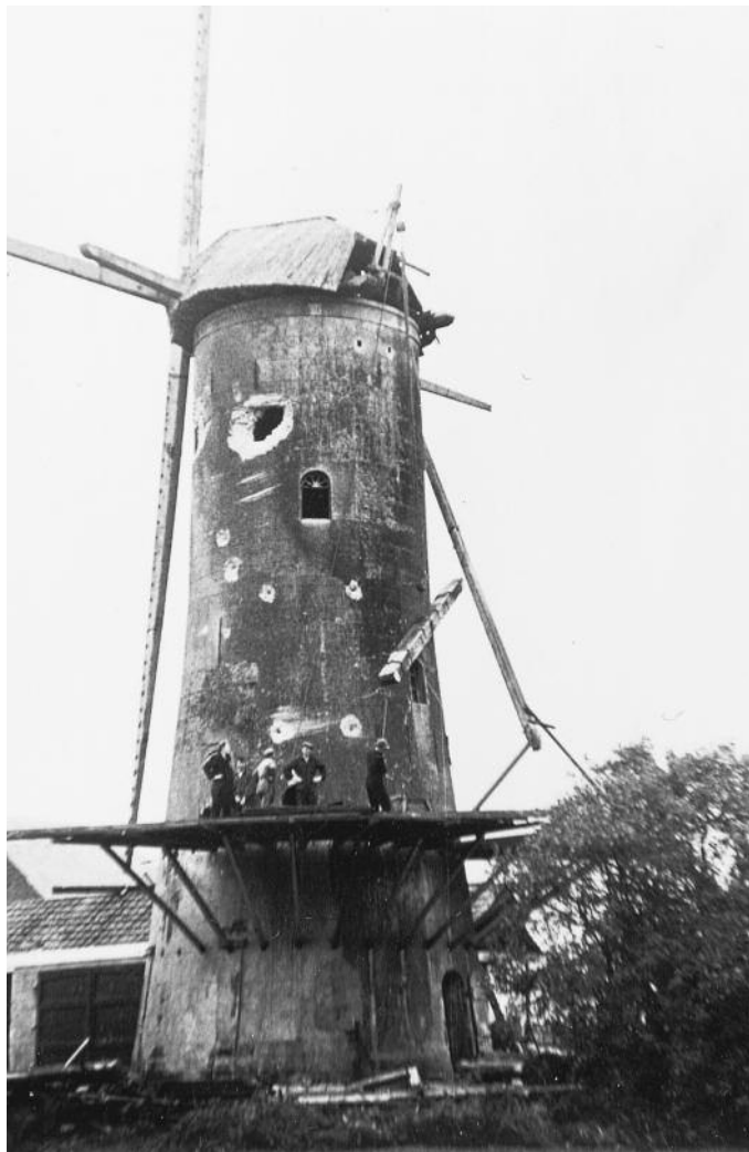
Het begin van het werk: het neerlaten van de korte spruit.

gen werd grote schade aangericht. Een Studebaker was zwaar beschadigd terwijl bij een Diamond-vrachtwagen het cardan er finaal onder uit geschoten was! Het pakhuis langs de Schie was in vlam-