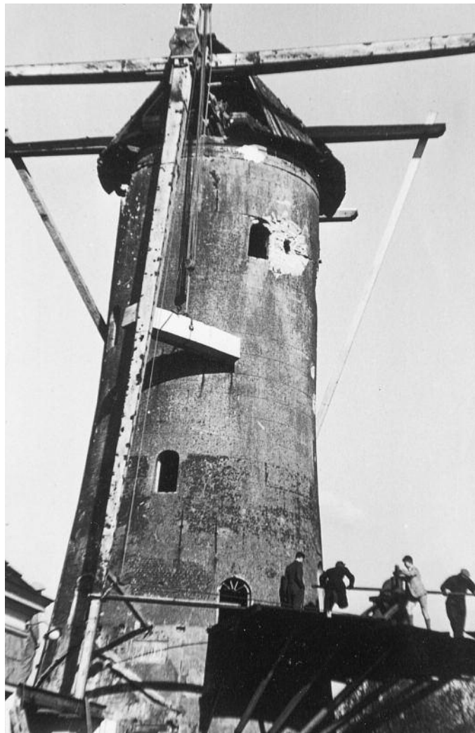
De nieuwe windpeluw gaat omhoog, het kaapstandertijdperk in de molenmakerij is nog niet zo heel lang afgelopen! Onder de gaten voor de balieliggers is de later verplaatste gedenksteen zichtbaar, toen met de erop geschilderde molen-naam.