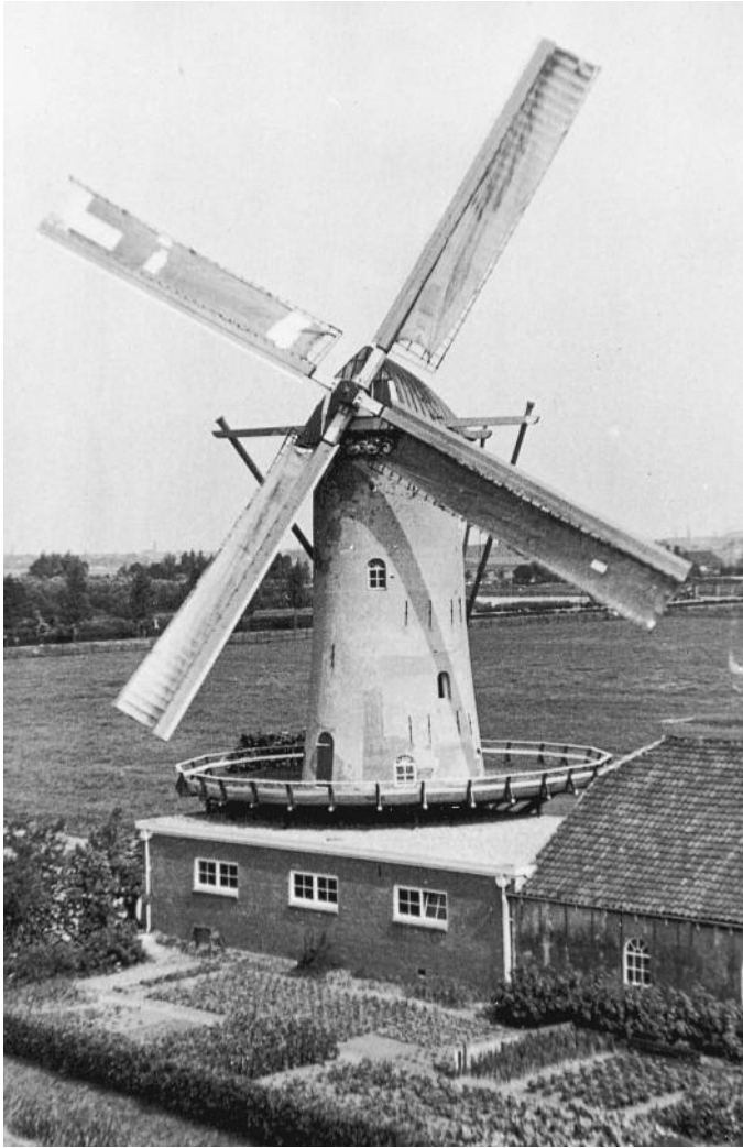
De molen van Speelman maalt weer.