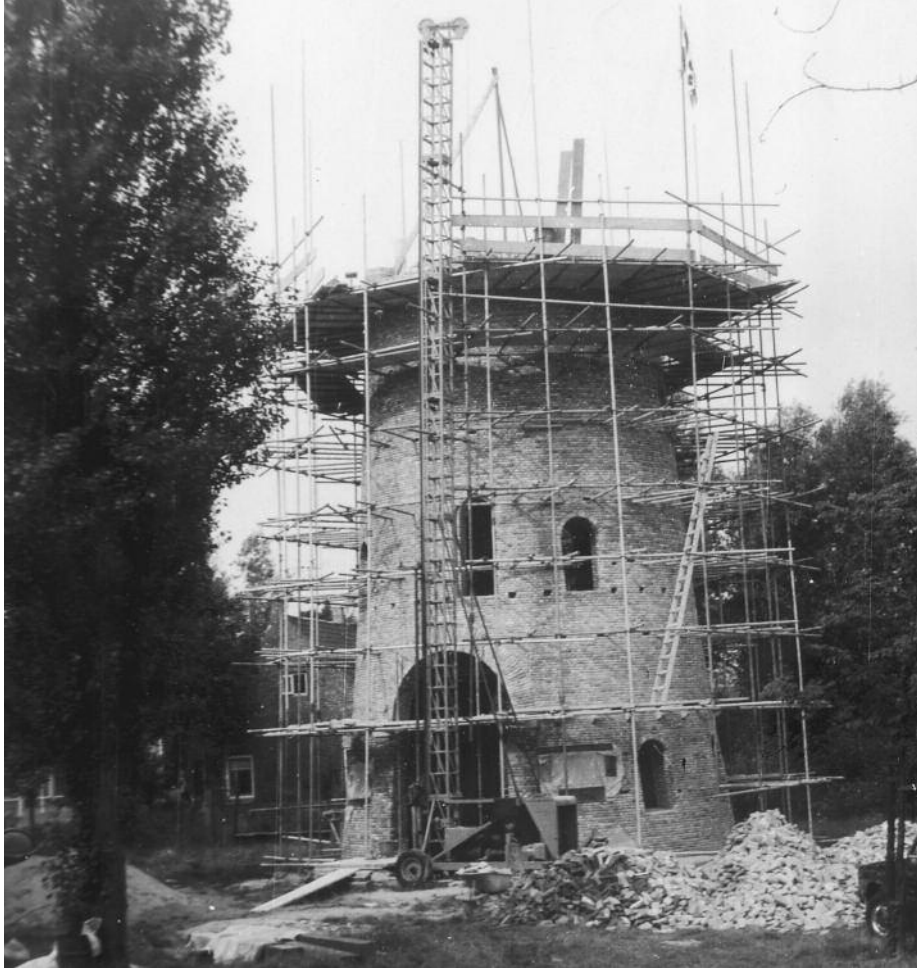
Herbouw van als De Speelman aan de zuidoostkant van Overschie, 10 augustus 1971.